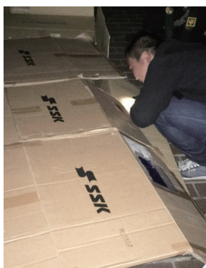
おにぎりを渡し、お話中

平成28年度は前年度の反省を踏まえ、路上に生活する方々の必要とする医薬品や物資類(ニット帽や冷えピタ等)を充実させました。そのせいなのか、上野文化会館周辺の追い出しや浅草の商店街の夜間電気点灯等の影響