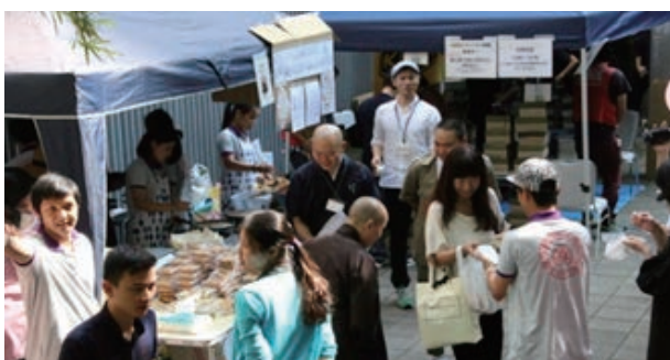
りんりんふえすの様子

東京の本部では、これまで継続してきた炊き出し夜回り支縁や葬送支縁、ビッグイシューサポートライブの応援などの他、新たな活動を計画しています。一つ目は、生活困窮者支援団体が行う簡易宿泊所やアパートで一人暮らしをしている方々への訪問事業に同行する活動です。二つ目は、炊き出しの会場の山谷光照院裏に設けられる「こども極楽堂」と提携して、子ども支縁活動への参加です。三つ目は、体調不良を訴える人の身体の観察法や薬品を渡す際の留意点についてなど、会員やボランティアメンバーに向けた研修会の実施です。上記のような新規事業を通じて、できるかぎり多角的に路上生活者や苦しい状態の子どもたちに心を寄せて参ります。